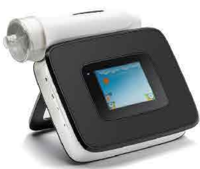
●一酸化窒素ガス分析装置

呼吸器疾患は、放置すると重篤な症状を引き起こす可能性があります。炎症が長期間続くと「リモデリング」と呼ばれる現象が起き、病状が慢性化し、治療が難しくなることがあります。そのため、「単なる咳」と軽視せず、信頼できるクリニックや病院で適切な治療を受けることが大切です。