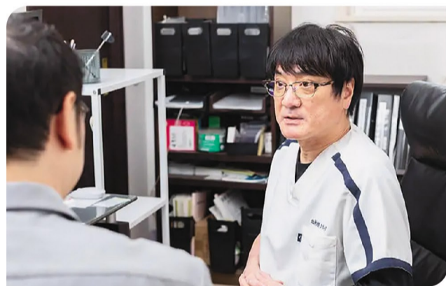
患者さまと対面した時の仕草や様子、お話の内容から症状の根本原因を探ります。