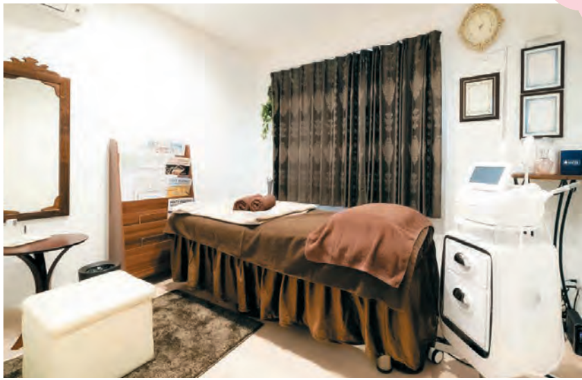
クリニック2Fのメディカルエステルーム。プラセンタ注射、ニンニク注射、ダイエット注射など点滴・注射は多数用意。自由診療の初診料は0円、回数券使用で1回1000円(税抜き)からと「患者様の健康維持のため」続けやすい価格設定にしている。