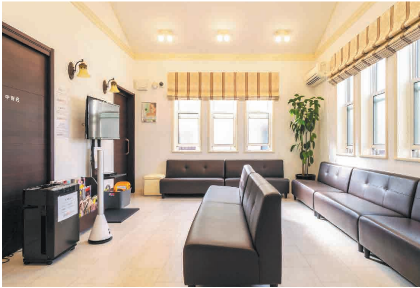
「選ばれるクリニック」を目指し、患者との信頼関係を大切にしている。その思いはしっかり通じており、笑顔と安心が得られる場所として、若い世代から高齢者まで幅広い層が健康維持のために通院する。オンライン診療も実施。